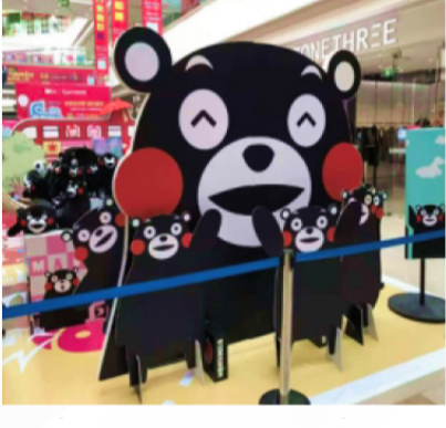
Reklam baskı endüstrisi