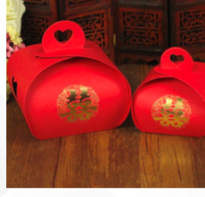
Özel tasarım işler