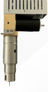
Ultra frekanslı elektrikli bıçak