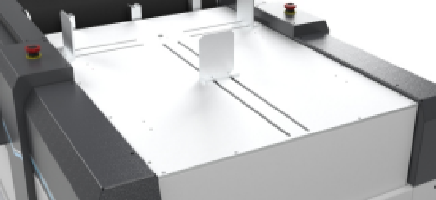
Asansörlü otomatik besleme sistemi